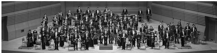
管弦楽 仙台フィルハーモニー管弦楽団

東京藝大指揮科、同大学院卒。在学中より作曲家・中田喜直氏の薫陶を受け、氏とのジョイントコンサートによりピアニストとしてデビュー。1996年ベルリンでのドイツ室内管弦楽団定期演奏会でコンサート指揮者デビュー。2010年より13年間にわたり、オーケストラ・アンサンブル金沢専任指揮者を務め、日本各地のオーケストラとも共演を重ねている。ポップスのアーティストからも信頼が厚く、森山良子、岩崎宏美、渡辺美里ら多くのコンサートを指揮、レコーディングにも参加している。東京藝術大学指揮科講師。